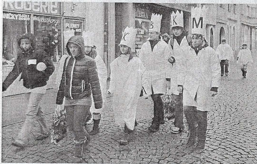
TŘÍKRÁLOVÁ SBÍRKA se konala včera ve Stříbře.