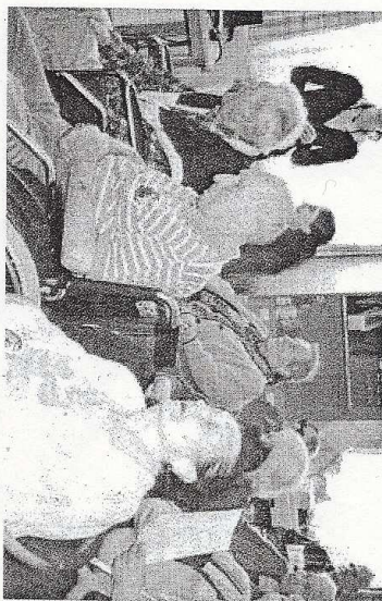
ZARÍZENÍ JE URČENO pro patnáct osob a v současnosti je plně vytiženo seniory ze Stříbra a okolí. Klienti domova se společně s personálem a hosty zúčastnili páteční mše.