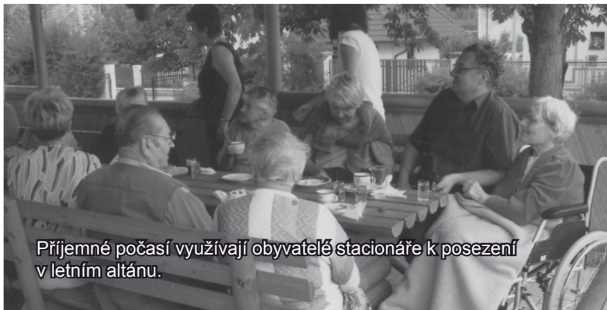
Příjemné počasí využívají obyvatelé stacionáře k posezení v letním altánu.