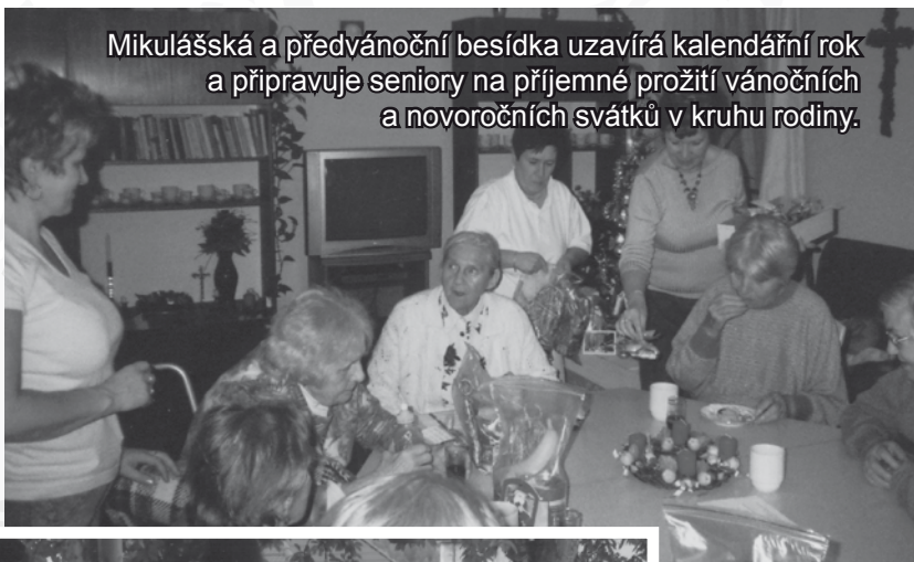
Mikulášská a předvánoční besídka uzavírá kalendářní rok a připravuje seniory na příjemné prožití vánočních a novoročních svátků v kruhu rodiny.