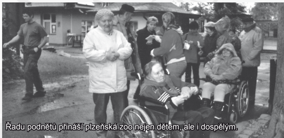
Řadu podnětů přináší plzeňská zoo nejen dětem, ale i dospělým.