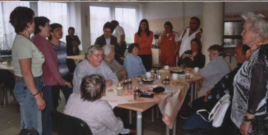
Už několik let se setkávají obyvatelé stříbrského stacionáře s obyvateli Domova pro seniory sv. Jiří v Plzni-Doubravce. Na společné odpoledne se všichni už tradičně těší.