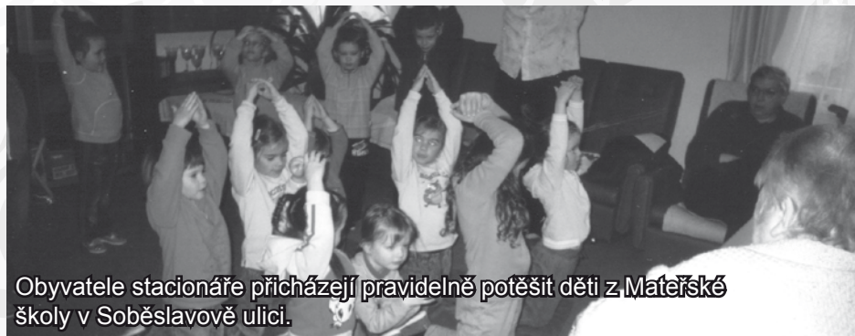
Obyvatele stacionáře přicházejí pravidelně potěšit děti z MATEŘSKÉ školy v Soběslavově ulici.